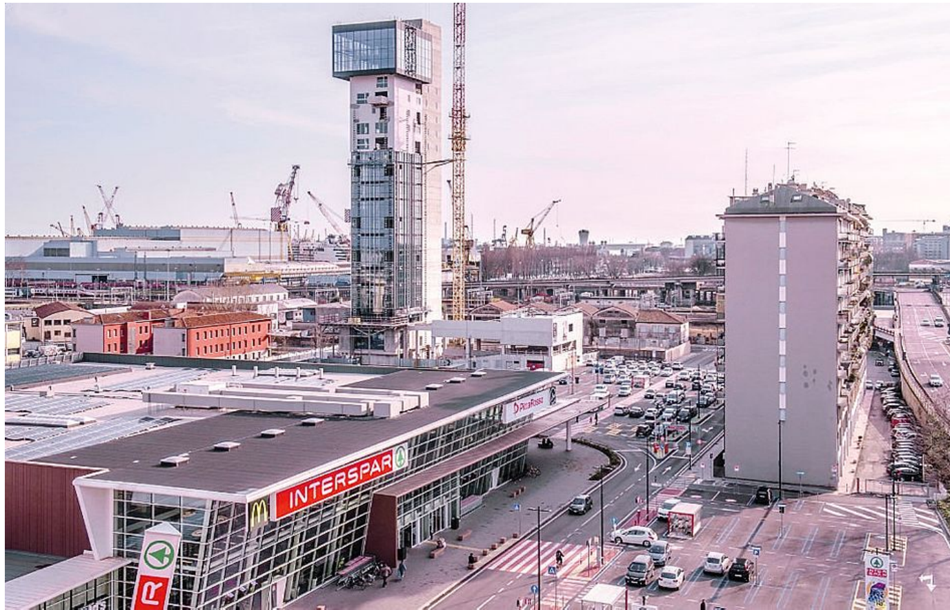
Alcune immagini della Hybrid Tower Mestre e le panoramiche che si possono ammirare salendo ai vari piani